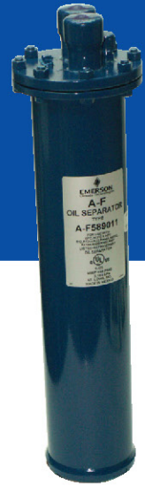
מפרידי שמן הלחמה או פלנג' 1\frac{1}{2}''-2\frac{1}{8}''