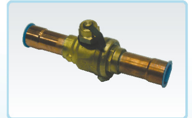
ברזים כדוריים 3\frac{1}{8}''-3\frac{1}{4}''