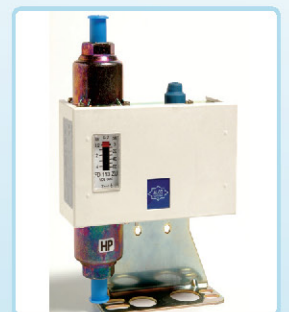
פרוסוסטטים לחץ שמן דיפרנציאלי