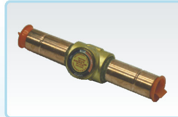
עין מראה (סייטגלאס)