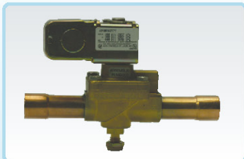
ברזים חשמליים - 1\frac{1}{4}''-2\frac{1}{8}'' סליל 220v, 110v, 12v