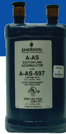
מפרידי נוזל 1\frac{1}{2}''-2\frac{1}{8}''