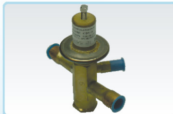
וסת תפוקה (שסתום זינגר)