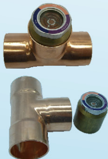
עין מראה להלחמה ב-D נחושת בקטרים 2\frac{1}{8}''-1\frac{3}{8}''