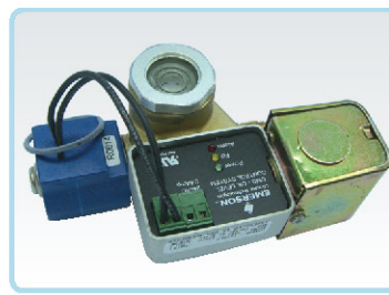
מצוף שמן אלקטרוני