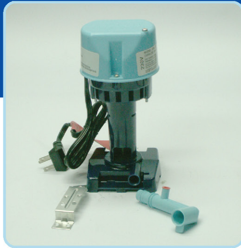
משאבת מים למצנני מידבר לספיקות שונות