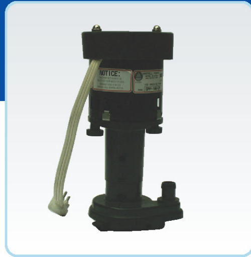
משאבת מים למכונת קרח