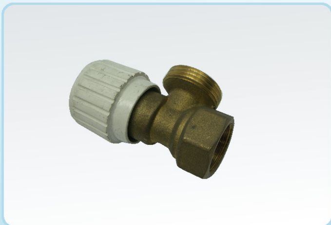
ברח ניתוק לפני קויל