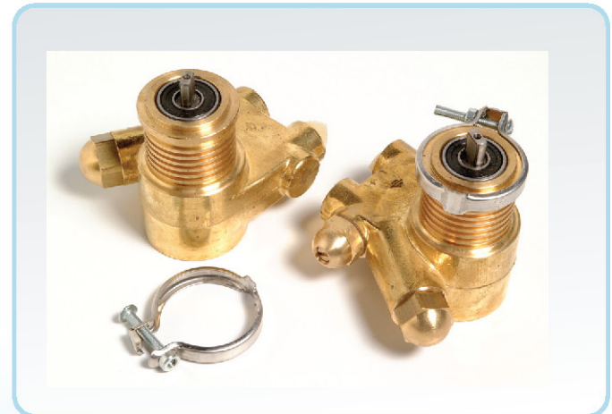
משאבות למכונות מזיגה. סודה וקפה מנירוסטה או פליז (עם או בלי מעקף)