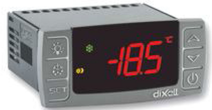
32x74 מ"מ, התקנה על פנל