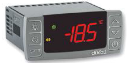
32x74 מ"מ, התקנה על פנל