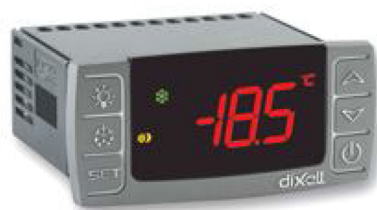
32x74 מ"מ, התקנה על פנל