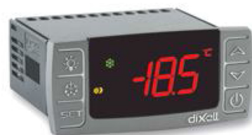
32x74 מ"מ, התקנה על פנל