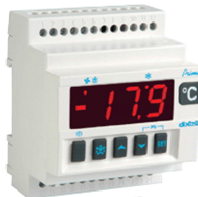
התקנה על מסילה DIN 4